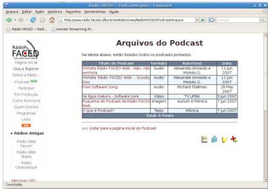
Figura 4.4: Tela do arquivo de posts do Podcast

tagem de descrição do arquivo a ser anexado. Ao final da página, há um aviso ao usuário indicando que o upload do podcast será feito após criação do tópico post , usando a própria interface de anexação do TWiki.