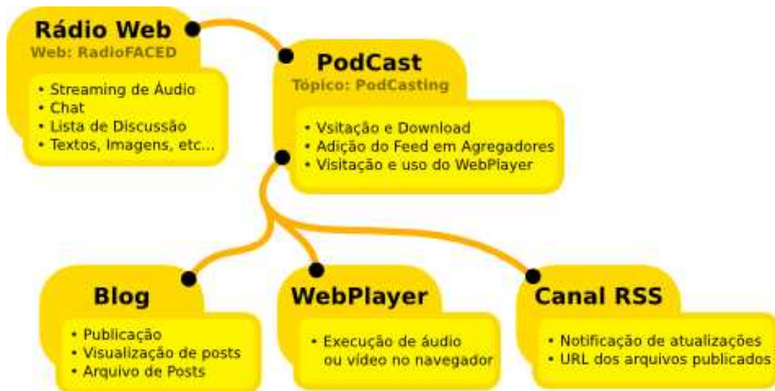
Figura 4.1: Esquematização das funcionalidades da Rádio FACED Web

A figura 4.1 a seguir, esquematiza a aplicação e suas funcionalidades e a demonstra como mais uma das funcionalidades da rádio Web: