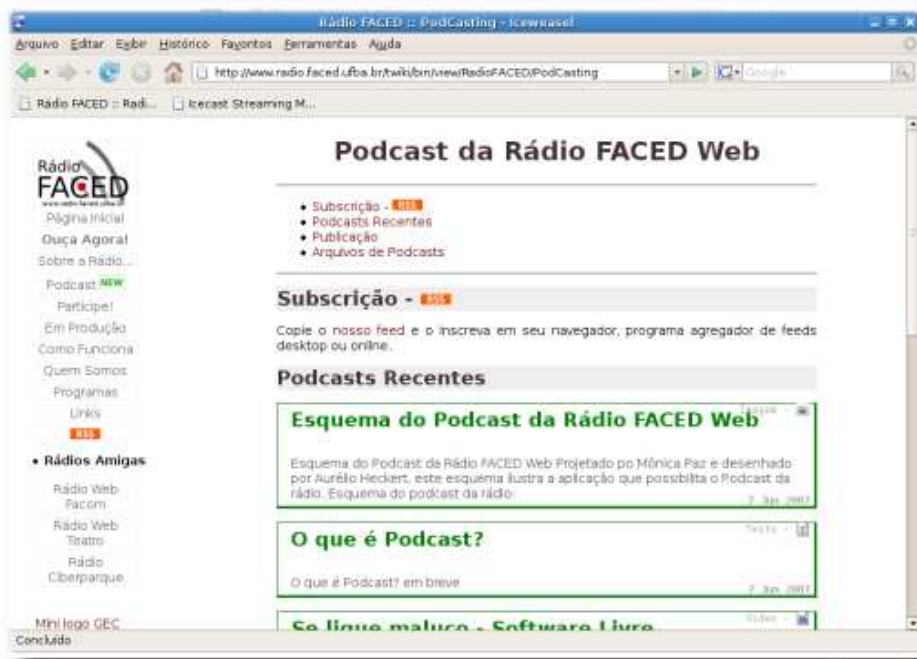
Figura 4.2: Tela inicial do Podcast