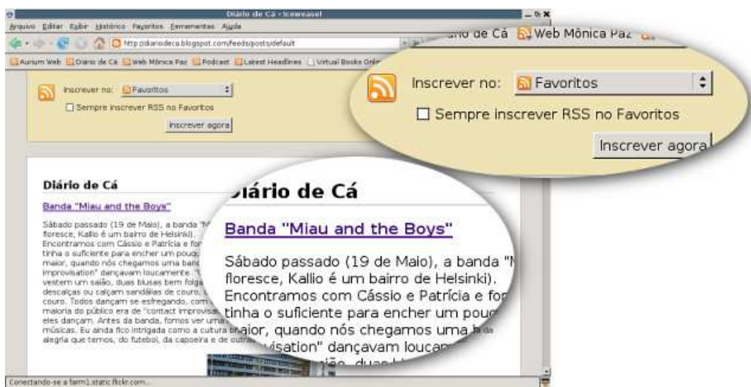
Figura 2.3: Detalhes da visualização e dos campos para subscrição do feed – navegador Web Iceweasel