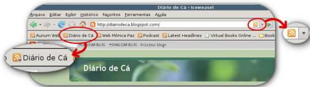
Figura 2.2: Feeds subscritos na barra de favoritos e ícone indicativo de canal RSS na barra de endereços – navegador Web Iceweasel