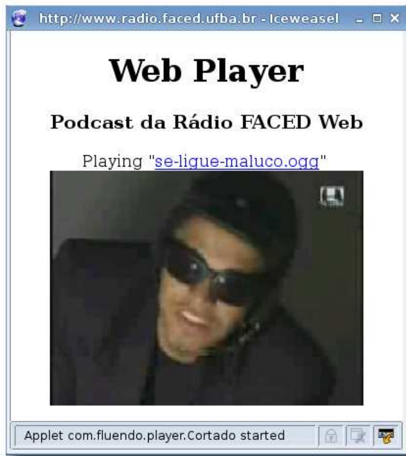
Figura 4.5: Janela Pop-up do Web Player do Podcast